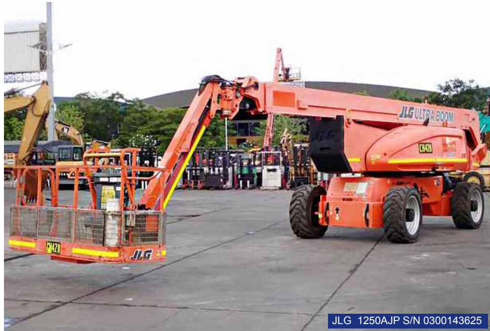
JLG 1250AJP S/N 0300143625