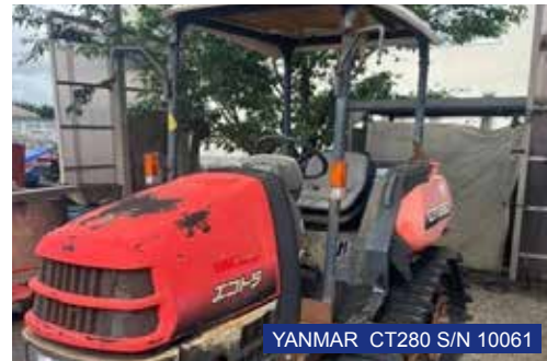
YANMAR CT280 S/N 10061