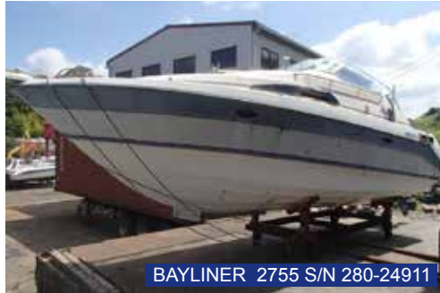
BAYLINER 2755 S/N 280-24911