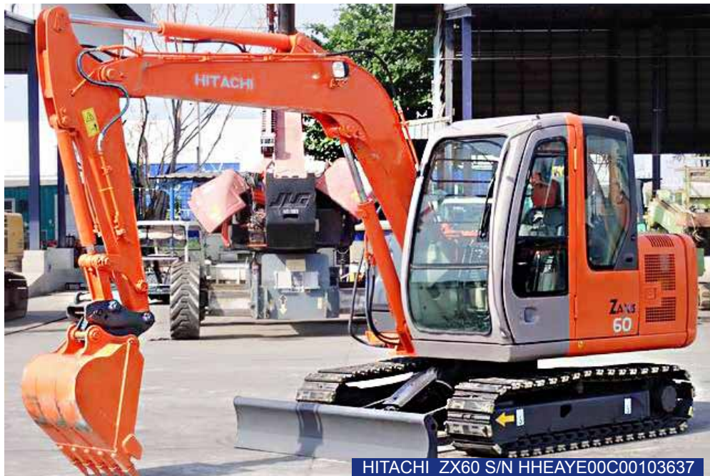
HITACHI ZX60 S/N HHEAYE00C00103637