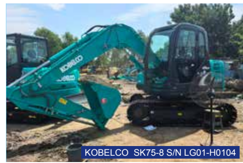
KOBELCO SK75-8 S/N LG01-H0104