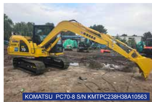
KOMATSU PC70-8 S/N KMTPC238H38A10563