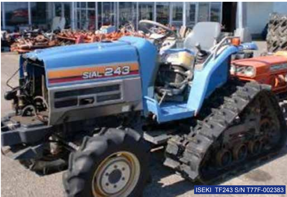
ISEKI TF243 S/N T77F-002383