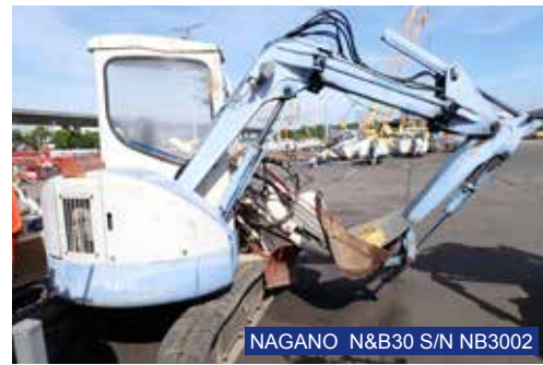
NAGANO N&B30 S/N NB3002