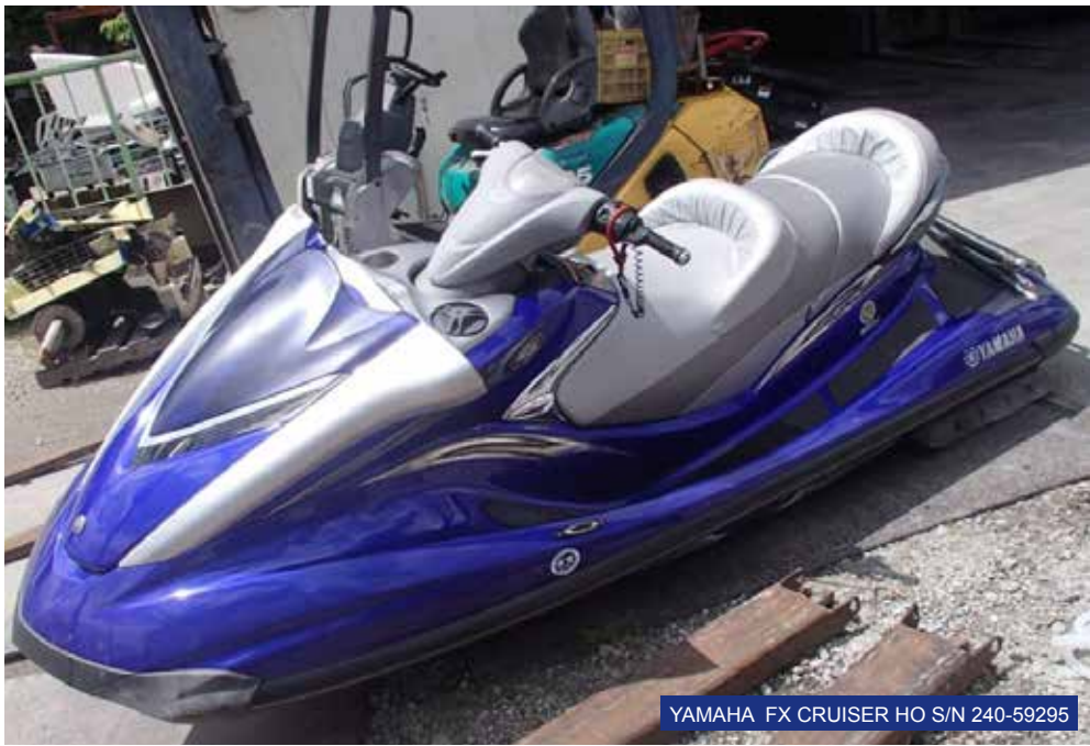
YAMAHA FX CRUISER HO S/N 240-59295