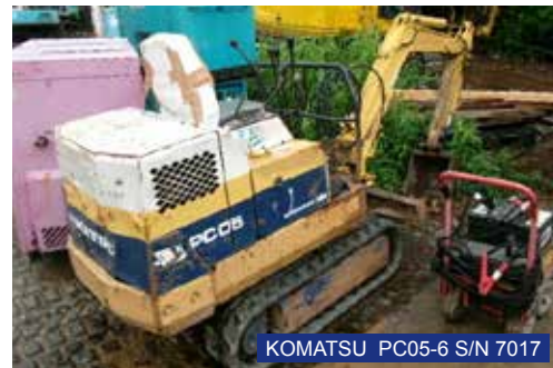
KOMATSU PC05-6 S/N 7017