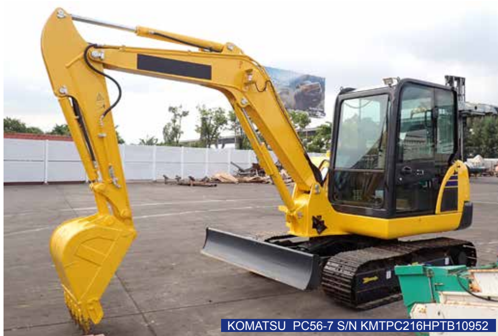
KOMATSU PC56-7 S/N KMTPC216HPTB10952