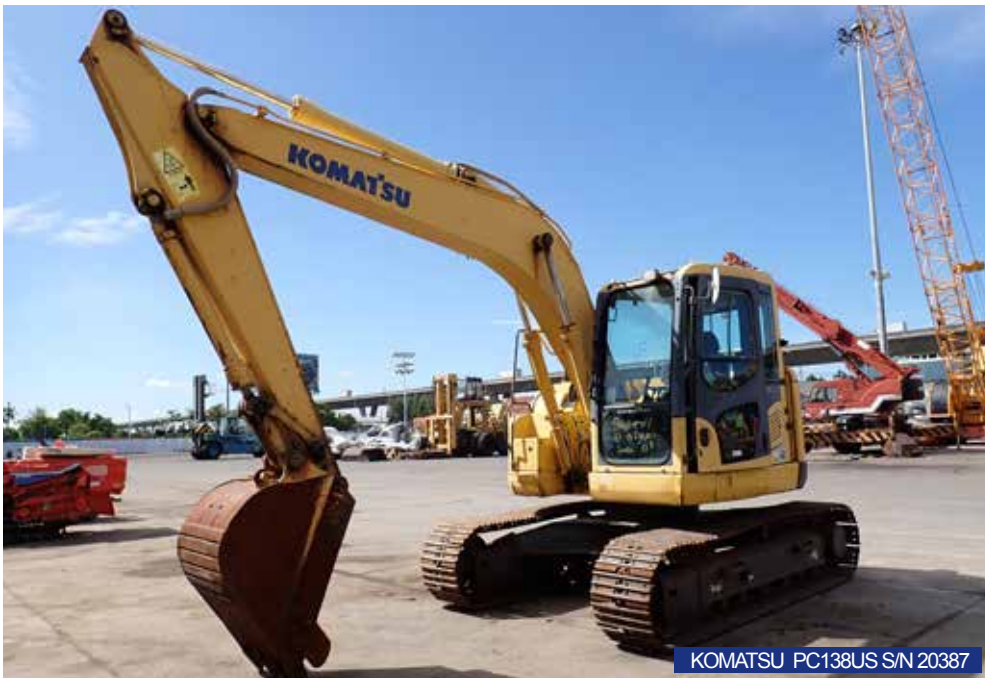
KOMATSU PC138US S/N 20387