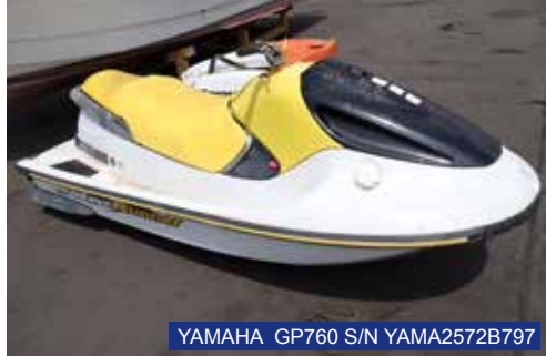
YAMAHA GP760 S/N YAMA2572B797