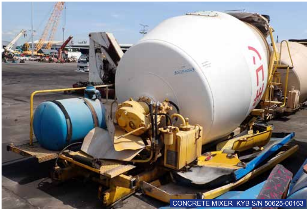
CONCRETE MIXER KYB S/N 50625-00163