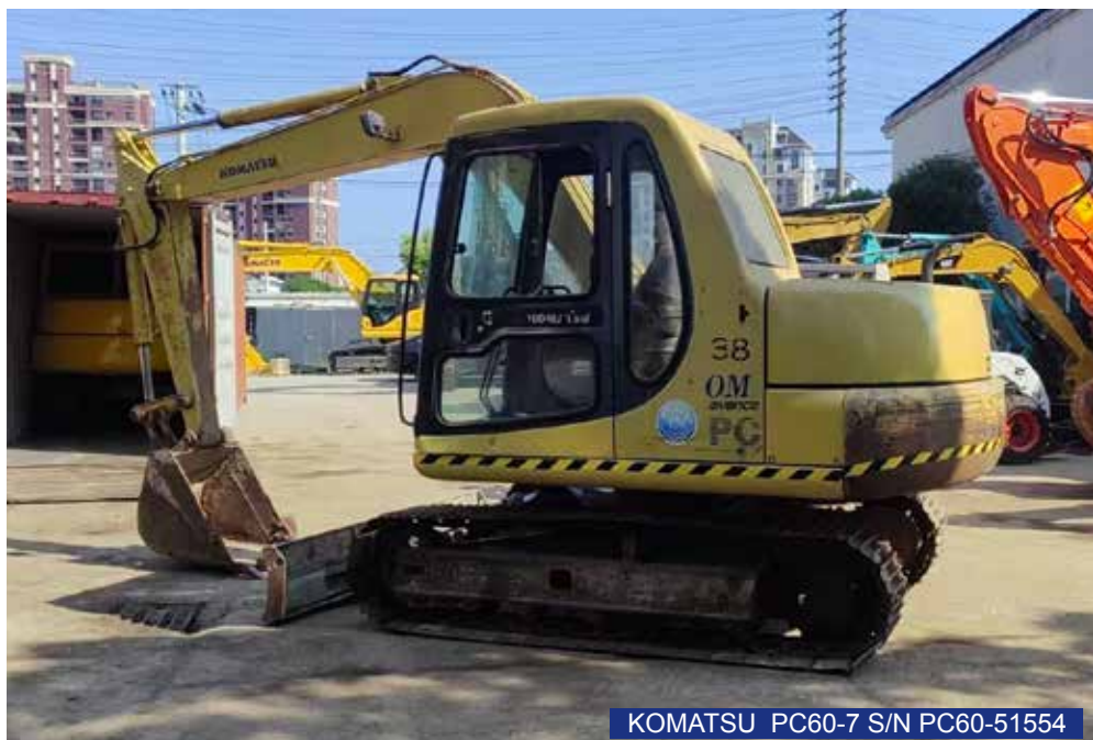
KOMATSU PC60-7 S/N PC60-51554