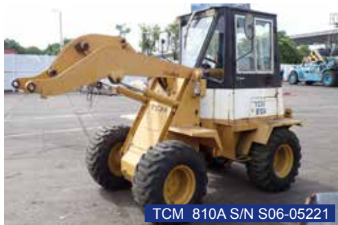
TCM 810A S/N S06-05221