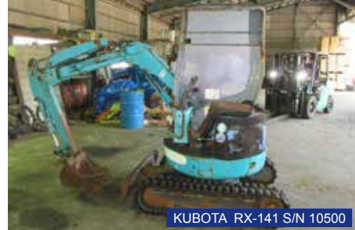
KUBOTA RX-141 S/N 10500