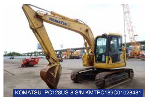
KOMATSU PC128US-8 S/N KMTPC189C01028481