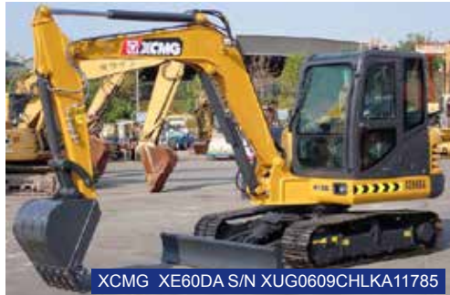
XCMG XE60DA S/N XUG0609CHLKA11785