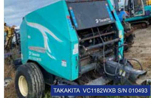
TAKAKITA VC1182WXB S/N 010493