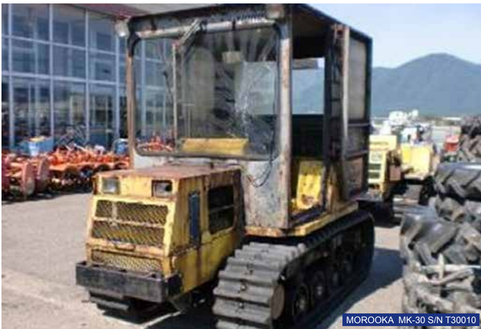
MOROOKA MK-30 S/N T30010