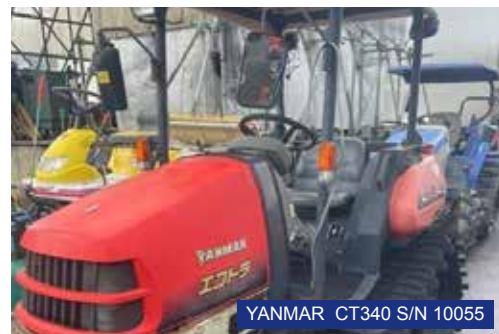
YANMAR CT340 S/N 10055