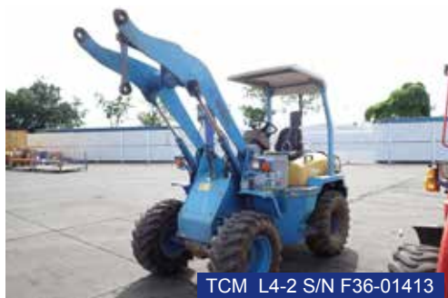
TCM L4-2 S/N F36-01413