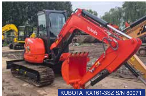
KUBOTA KX161-3SZ S/N 80071