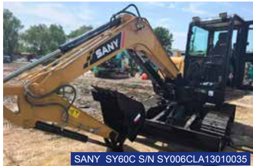
SANY SY60C S/N SY006CLA13010035