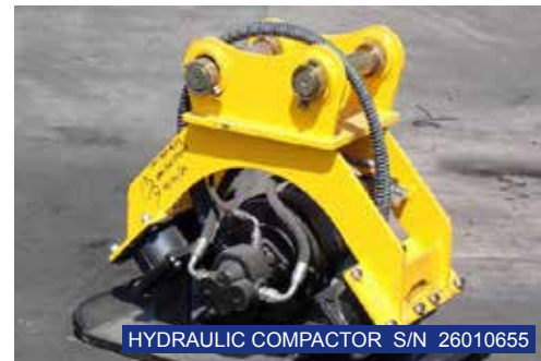
HYDRAULIC COMPACTOR S/N 26010655