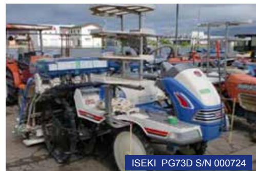
ISEKI PG73D S/N 000724