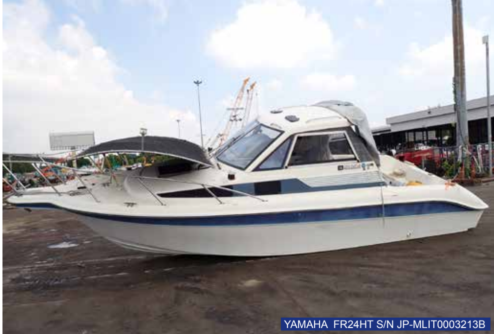
YAMAHA FR24HT S/N JP-MLIT0003213B