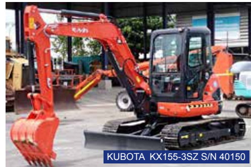
KUBOTA KX155-3SZ S/N 40150