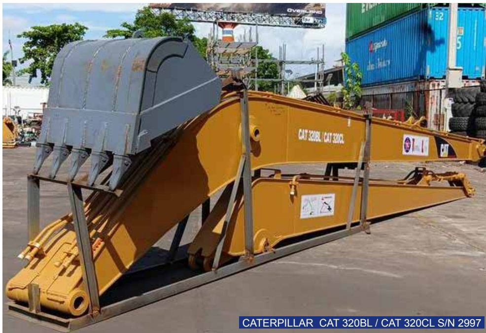
CATERPILLAR CAT 320BL / CAT 320CL S/N 2997