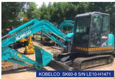
KOBELCO SK60-8 S/N LE10-H1471