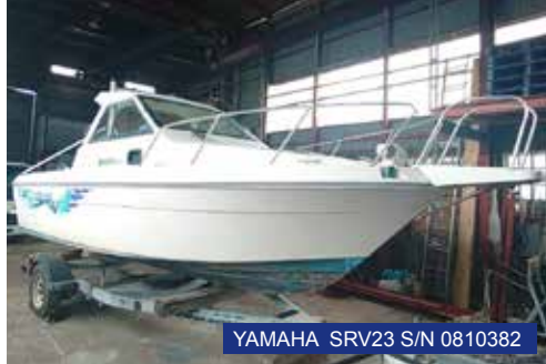
YAMAHA SRV23 S/N 0810382