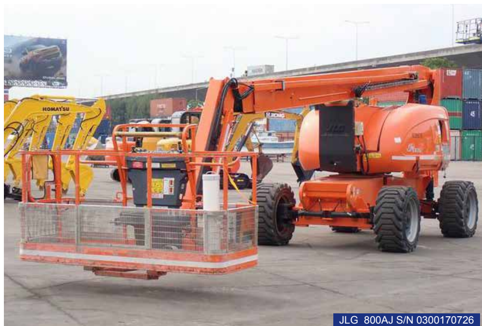
JLG 800AJ S/N 0300170726

กรณีที่ใช้ SHIPPING นอกบริษัท จะต้องชำระค่าเอกสารนำเข้า 550 บาท ต่อสินค้า 1 รายการ