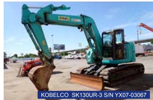
KOBELCO SK130UR-3 S/N YX07-03067