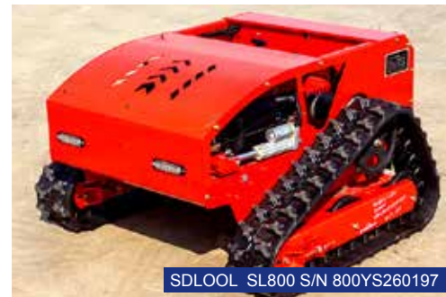
SDLOOL SL800 S/N 800YS260197