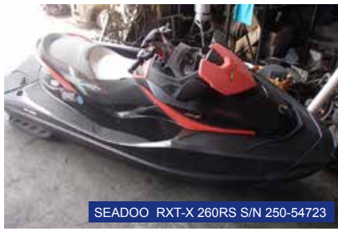
SEADOO RXT-X 260RS S/N 250-54723