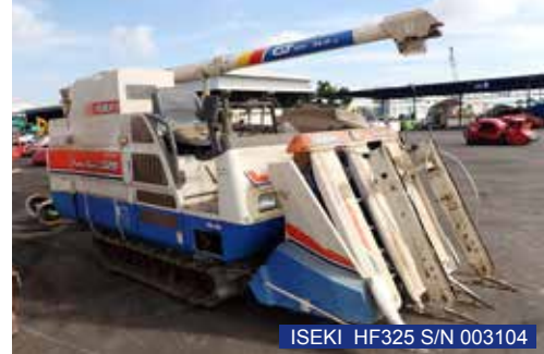
ISEKI HF325 S/N 003104