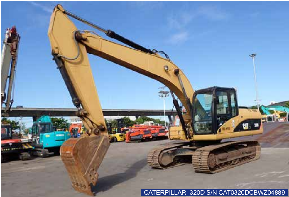
CATERPILLAR 320D S/N CAT0320DCBWZ04889