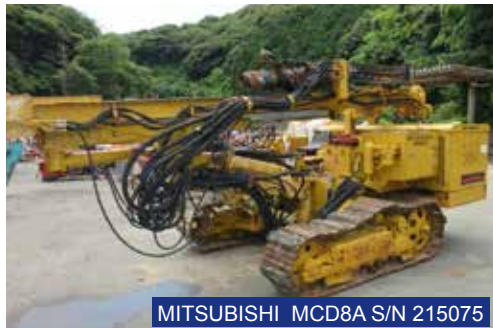
MITSUBISHI MCD8A S/N 215075