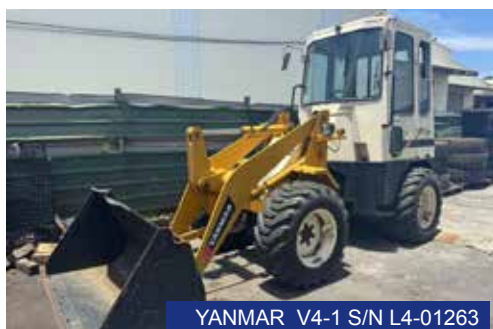
YANMAR V4-1 S/N L4-01263