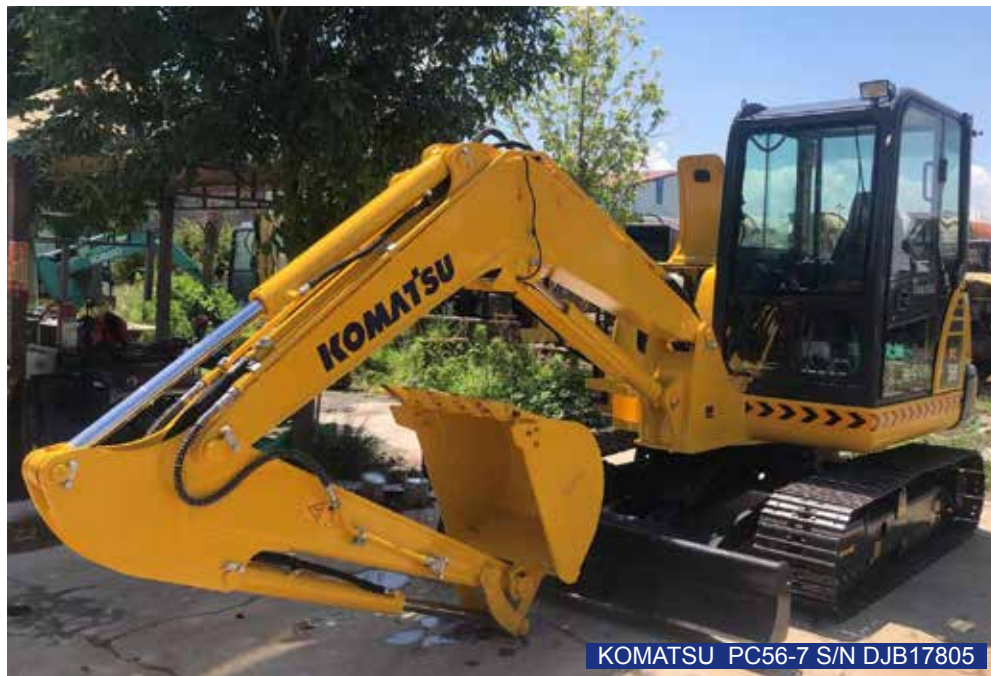
KOMATSU PC56-7 S/N DJB17805